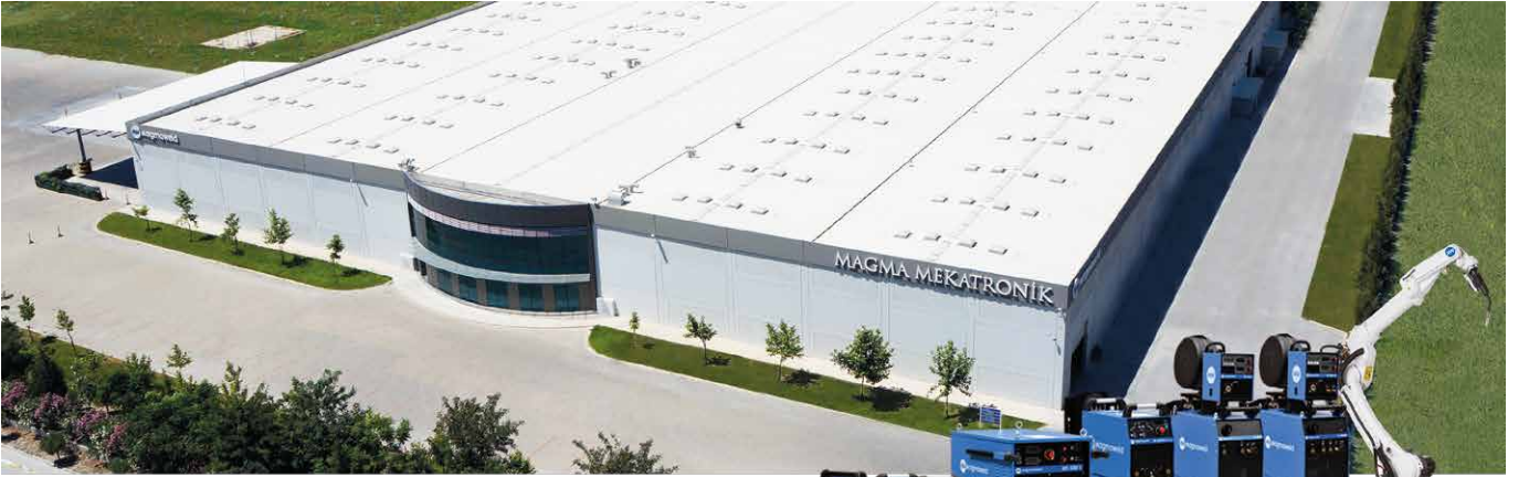
Kaynak Makineleri ve Otomasyon Fabrikası Organize Sanayi Bölgesi 5. Kısım, Manisa

Türkiye'deki lider pozisyonunu pekiştirmek, maliyetleri düşürmek ve global bir marka olabilmek için 1996 yılında Manisa'da büyük bir yatırım yaparak tüm Ar-Ge, Üretim, ve Lojistik faaliyetlerini buraya taşımıştır. Bu yıla kadar Grup, tüm kaynak ürünlerini OERLIKON ve HALKALI markaları ile satarken, global pazarlarda büyüebilmek için yepyeni, genç, ve uluslararası bir marka olarak MAGMAWELD'i yaratmıştır. Markanın adı, dünyanın merkezindeki eriyik, magma ile kaynak banyosunun benzerliğinden yola çıkılarak oluşturulmuş ve tüm dünyada isim hakkı tescil ettirilmiştir.