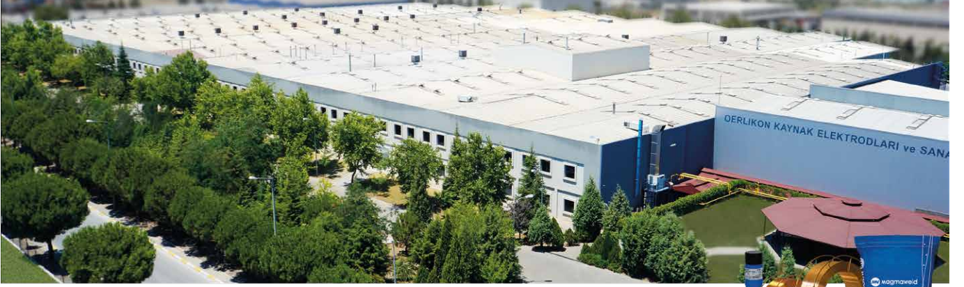
Kaynak Tüketim Malzemeleri Fabrikası Organize Sanayi Bölgesi 2. Kısım, Manisa

Magmaweld , Zaimoğlu Holding A.Ş. bünyesinde yer alan lider bir kaynak ürünleri markasıdır. Grup bünyesindeki en eski şirket olan Oerlikon Kaynak Elektrodları ve Sanayi A.Ş., 1957 yılında kurulmuş ve bir İsviçre şirketi olan Oerlikon Bühler AG den aldığı lisans ile 1959 yılında Türkiye'de ilk kaynak elektrodunu üretmiştir. Yıllar içinde sanayinin gelişimi ile beraber kaynak tüketim malzemeleri ihtiyacına cevap vermek üzere MIG/MAG ve TIG Telleri, Özlü Teller, Tozaltı Tozları ve Tellerini üretim programına katmıştır. 1971 yılında başladığı Kaynak Makineleri üretimi, 1998 yılında Panasonic ile kurulan iş ortaklığı ile Robotik Sistemlere kadar uzanmaktadır.